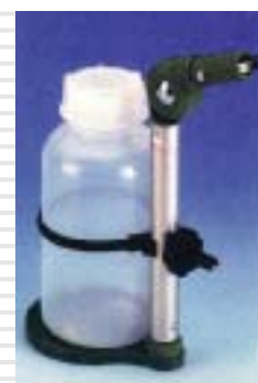
Bécher de prélèvement Beakers for bleeding