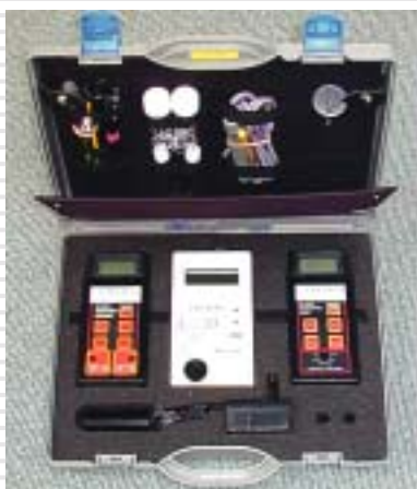
Mallette appareillage / Equipment case