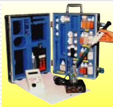
Laboratoire portable / Portable laboratory

Couleur/ Colour water 15 à 200 mg Pt Co/l Température / Temperature pH mètre / PH meter Chlore libre DPD / Free chlorine DPD 0,02 à 0,35 mg/l Chlore total DPD / Total chlorine DPD Nitrites / Nitrites 0,1 à 2,0 mg/l Ammoniaque / Ammonia Sulfates / Sulphates Fer / Iron 0,06 à 1 mg/l et 0,3 à 5 mg/l Manganèse / Manganese 0,05 à 2 mg/l Orthophosphates / Ortho phosphates Dureté total TH / Total hardness Alcalinité totale TAC / Total alkalinity Chlorures / Chlorides Oxydabilité au permanganate / Organic matters pH d'équilibre / Equilibrium pH CO2 libre / Free CO2 CO2 agressif / Aggressive CO2